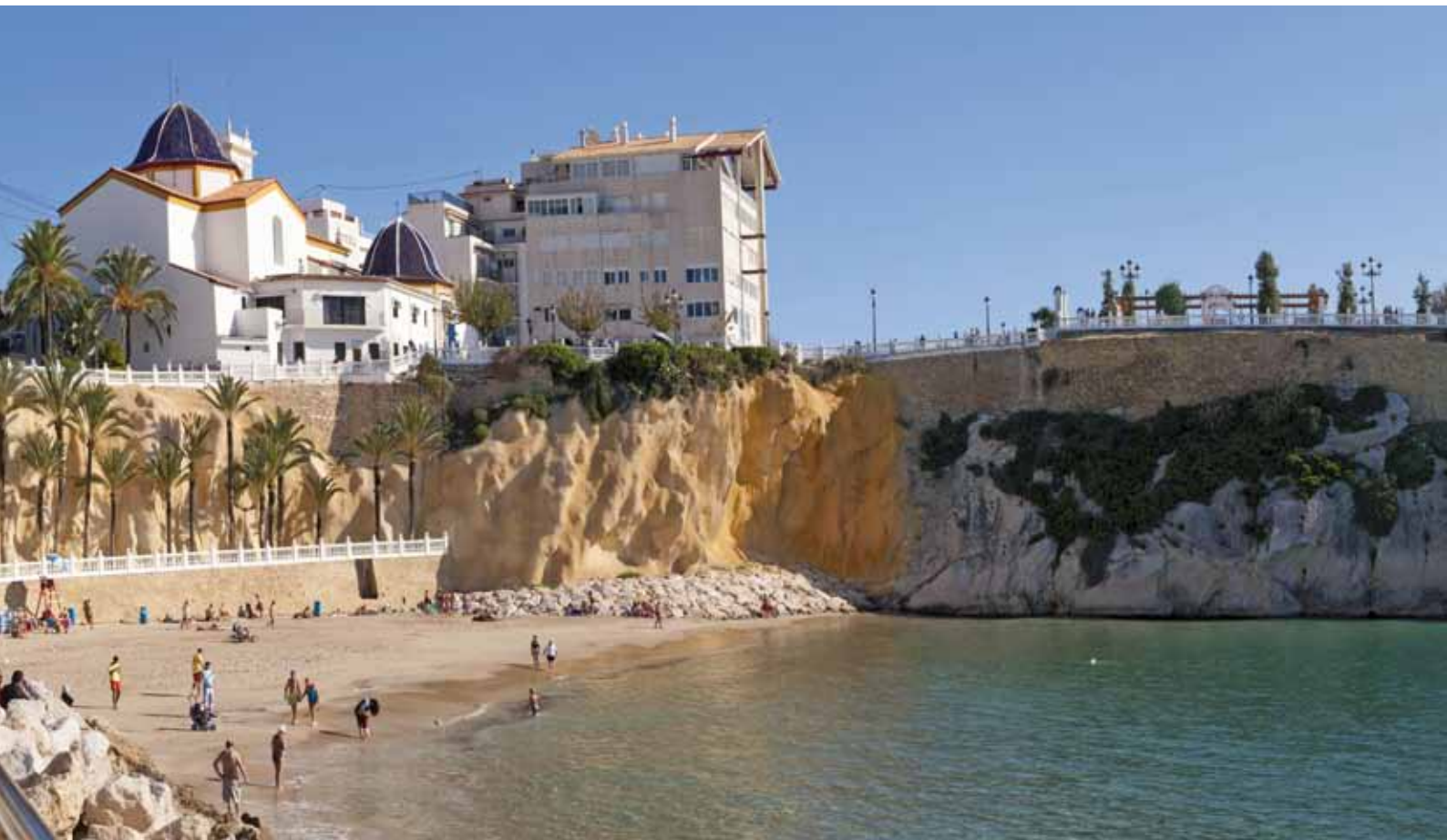
Mal Pas baaitje

Benidorm heeft de beste stadsstranden van de Middellandse-Zee kust: Levante en Poniente. Beide stranden bieden kristalhelder water, fijn zand, kwaliteitskeurmerken, blauwe vlaggen en talrijke diensten voor een uiterst comfortabel verblijf aan zee. De twee stranden genieten van de bescherming van de baai tegen storm en dankzij hun zuidelijke oriëntatie straalt de zon er urenlang, van bij zonsopgang tot in de late avond