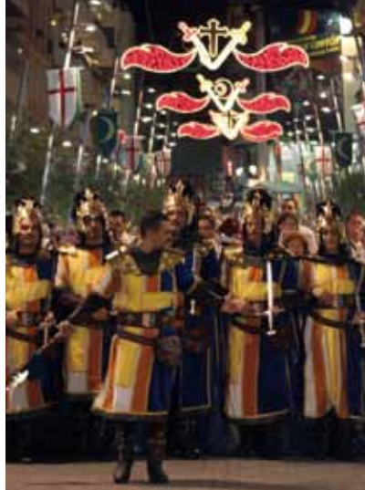
Moren en Christenen