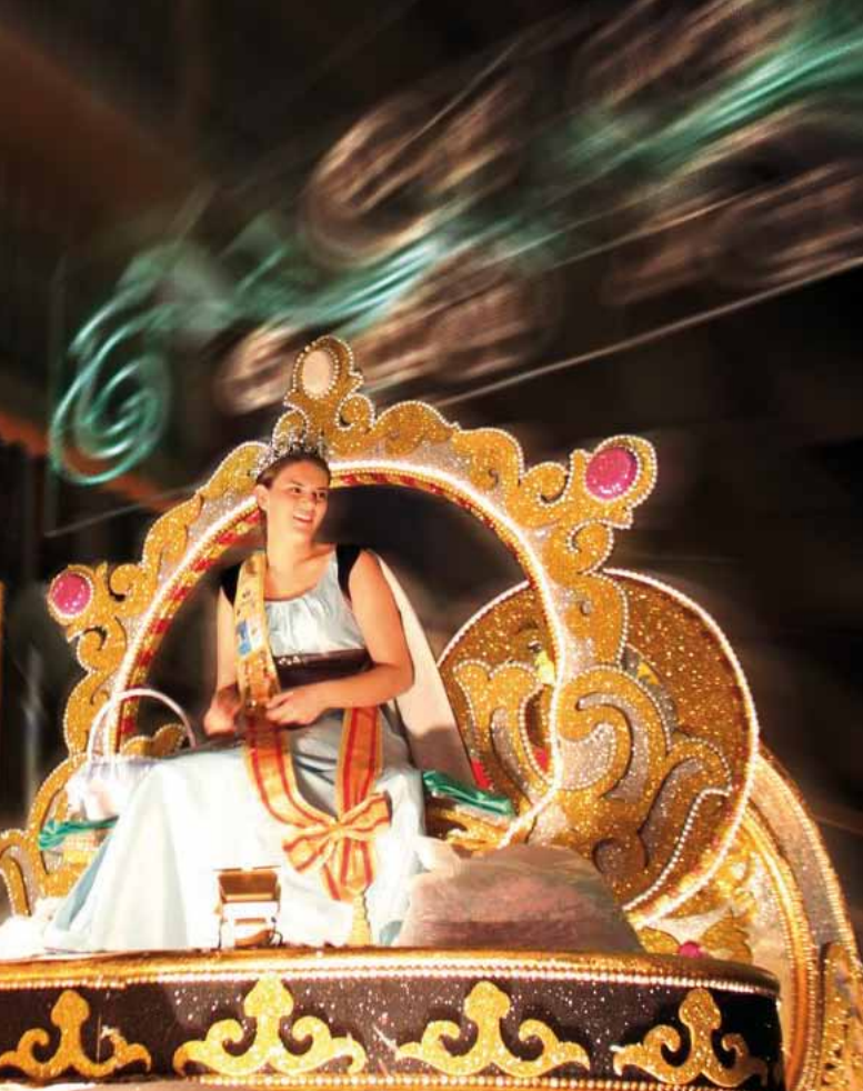
Parade van Praalwagens