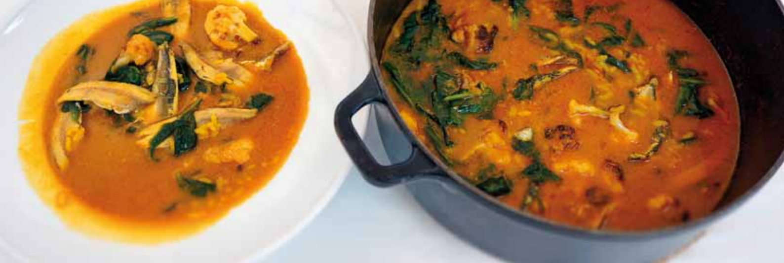
Caldero rijst met ansjovis