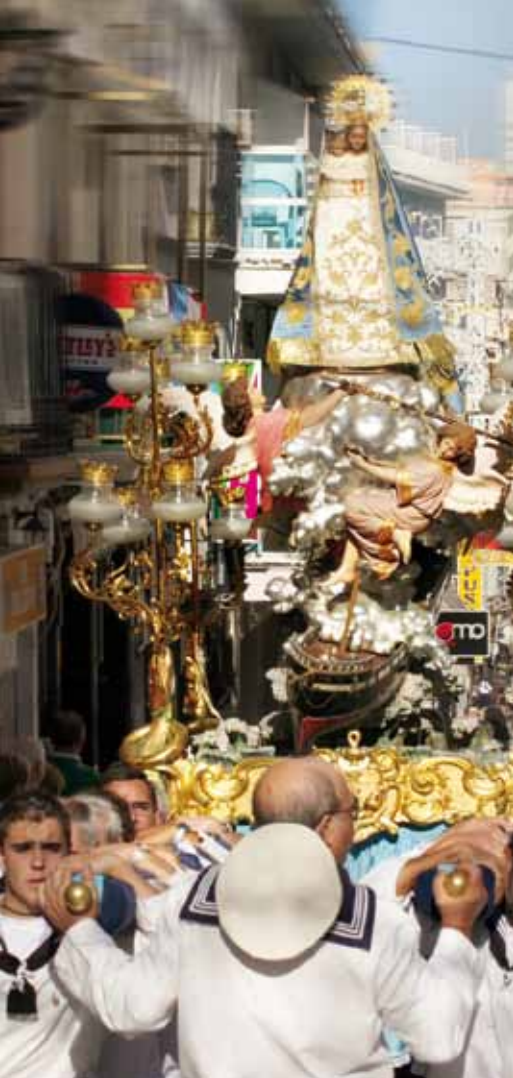
Processie van de patroonheilige van Benidorm

bedevaart ter ere van San Isidro Labrador, waarbij de bedevaarders naar de kapel Ermita de Sanç trekken.