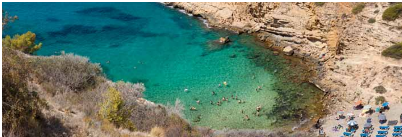
Tío Ximo baaitje