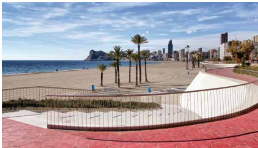
Poniente strandboulevard, Spaanse Architectuurprijs 2011

Aan het andere uiteinde ligt El Tossal de La Cala, met een ongelooflijk uitzicht over o.a. de overblijfselen van een Romeins castellum. De kapel La Ermita, op weg naar El Tossal de La Cala, herbergt een beeld van de maagd Virgen del Mar. Vlakbij, op het uitzichtspunt van hotel Bali, hebt u een indrukwekkend uitzicht in vogelperspectief.